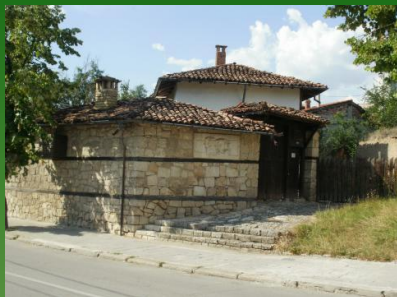
къща-музей Станка Николица, първа българска поетеса