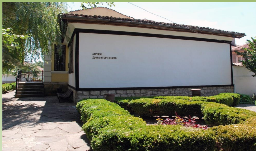
къща-музей на Димитър Ненов, композитор